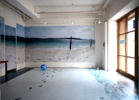
「LGT WORKSHOP海の家」と題して大判プリンターで壁面、床面などなどWORKSHOP内を海の装飾でまとめました。