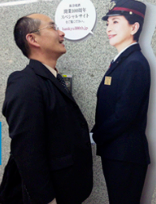
大阪梅田の阪急電車校内で壁面に掲示されていた印刷物です。恐らく塩ビに大判出力したものだと思います。