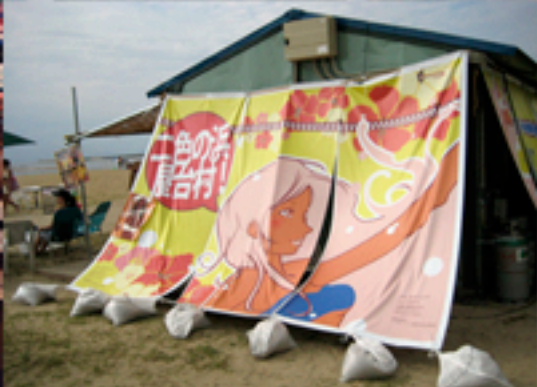
大阪貝塚市「二色の浜」の海の家をターポリンにて約20m×3mで装飾した様子です。