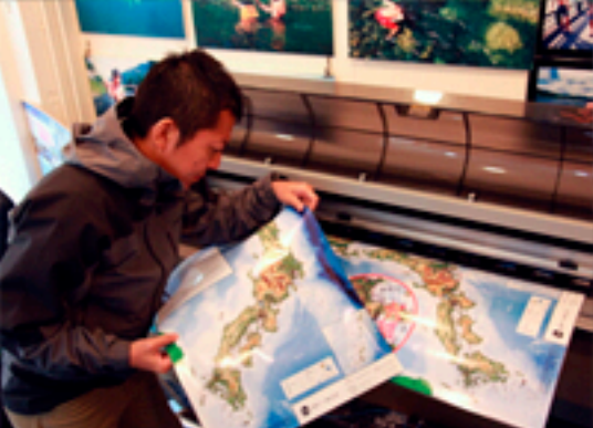
大判印刷物のチェック中アウトドアだけでなくたまには？真面目に仕事しています。