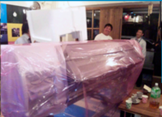
HP最新ラテックスプリンター Designjet L25500デモ機のWORKSHOP搬入の様子です。