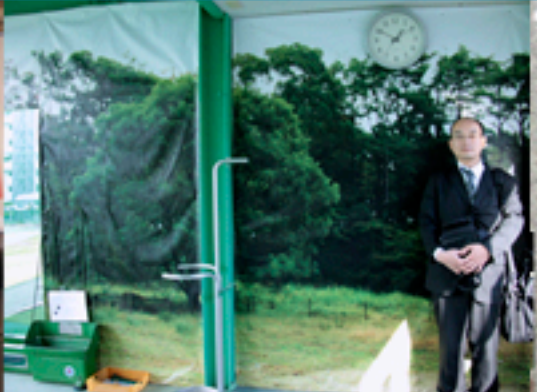
昨年末、大阪新御堂のゴルフセンターにてターポリンで壁面に約5m×2.5mの巨大装飾をさせていただきました。