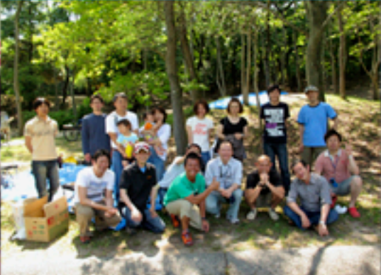
秋のバーベキューパーティでの集合写真です。晴天に恵まれ多くの皆様に参加していただきました。