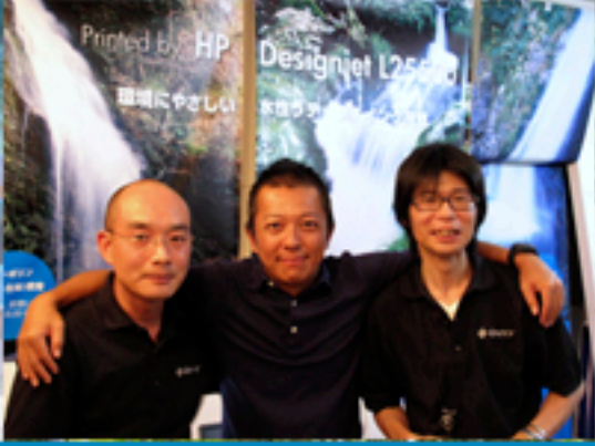
LGT大阪メンバーの内の3名です。WORKSHOPにて大判プリンターの検証デモ・またイベントを行っています。