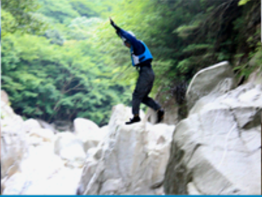
アウトドアの沢登り「淡水浴」滋賀県近江市神崎川での淡水浴清流に飛び込む瞬間です。