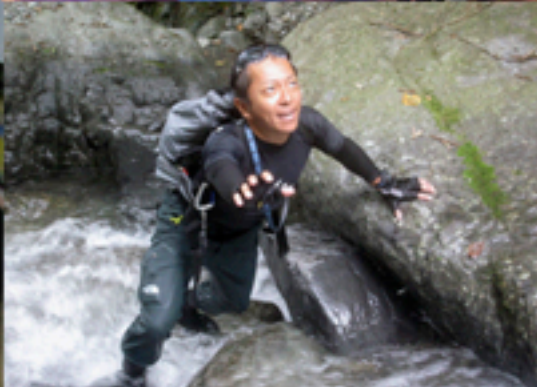
アウトドア 沢登り「淡水浴」にて必死の形相雄大な大自然でのリラックスのひと時。