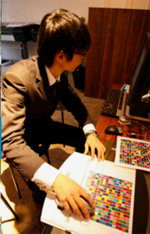
ONYX Productionhouseにてプロファイル作成の最中。プリントしたバッチを読み取っています。