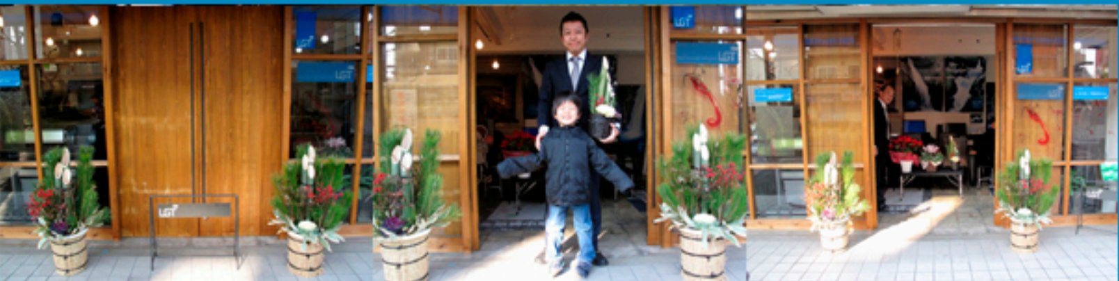
2011年 元日 大阪 花問屋 和秀様より大変立派な門松をいただきました。まことにありがとうございました！早速記念撮影です。