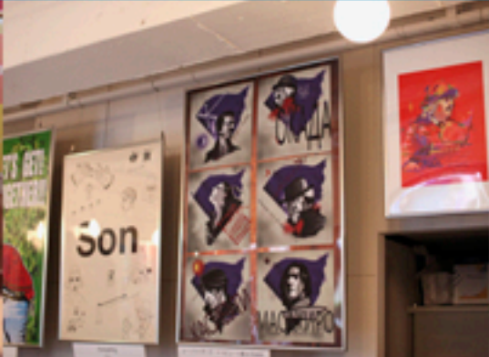
WORKSHOPのOPENイベントでカメラマンイラストレーター様の大判印刷の展示会の様子です。